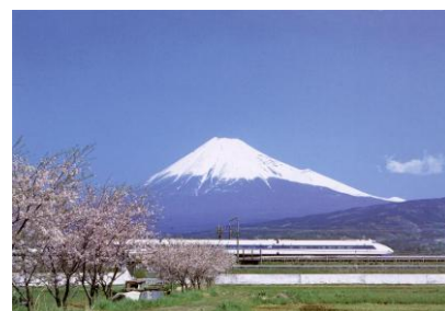
写真-1 富士山を背に走る新幹線

では、なぜ新幹線がこれほどのナショナル・シンボルとして機能しているのか。それはこれまで見てきたように、新幹線の建設にあたっては、国民全体の支持を仰ぎ賛同を得て推進していったのであり、その国民参加の共通体験が存在していたからこそだと考えることができよう。国民の新幹線計画への賛同は、新幹線が自分たちの願望としての「夢」を実現してくれることで、自分たちの確固たるナショナル・アイデンティティを確立してくれるだろうという期待のもとに表明された。つまり新幹線の実現とはすなわち、国民の夢の実現であり、国民にとってナショナル・アイデンティティの確立と写ったと考えることができる。そして前者の新幹線の「実現」と後者のアイデンティティの「確立」を重ね合わせ、新幹