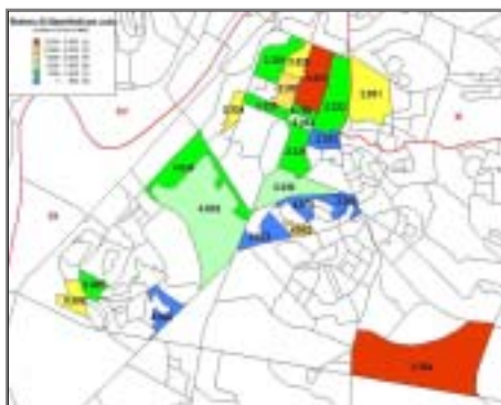
図1 従業員の通勤実態 分析例 (センサス地区別の従業員居住密度を GIS データ化)

る。その結果、2003年4月現在、304社にコンタクトし、9割以上がモビリティ・マネージャーを設置済みである。設置した会社の従業員総数は35万人となっている。