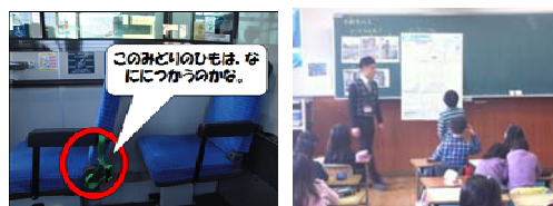
写真-1 低学年向けモデル授業の様子