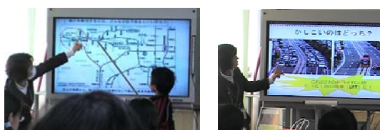
写真-3 高学年向けモデル授業の様子