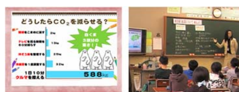
写真-2 中学年向けモデル授業の様子