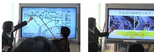
写真-3 高学年向けモデル授業の様子