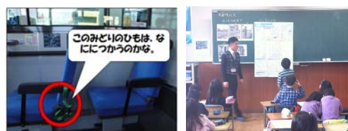
写真-1 低学年向けモデル授業の様子